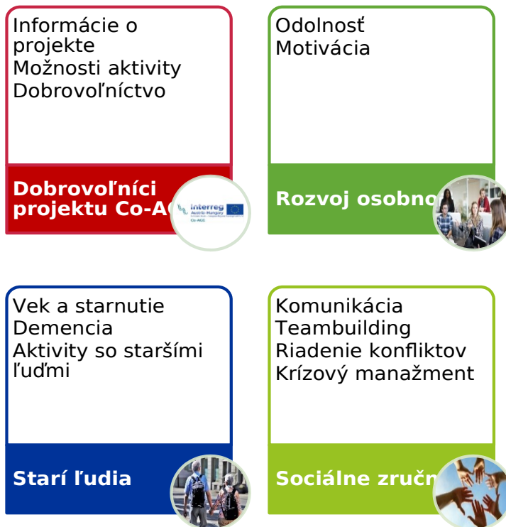
Obrázok 3: Prehľad modulu